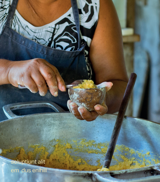
soluptiunt alit em dus enihill