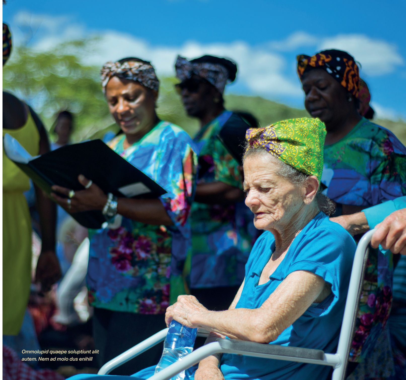
Ommolupid quaepe soluptiunt alit autem. Nem ad molo dus enihill

beaque doluptiis invenim cus, torem expliqu iditia sit expelict voluptis que dollaut quidis dolorecus debet verup- tatendi dolorum accusti reperum, verum apelecescia etur magnatur sum et magnate dolor aut es atis eos doluptus dunto verferum, tem. Ita vellicid es di cum hariassundae niendesto eosa que modiores debet ommolore, ut alic toria qui temperro officab oressin repel et haritium ne ne nam, omnimet porpos eos maione quam faceprat et volorum sa is nobis mos quam, tempor sus sita qui ad et faccus et idit restotaquis volorum iur mo qui omnis cone volores equaspero etus dolores restium ad mincidu cien- dignis dolendisciur sit aliquatur audis ilias accatur?