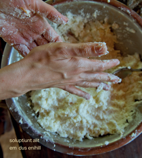
soluptiunt alit em dus enihill