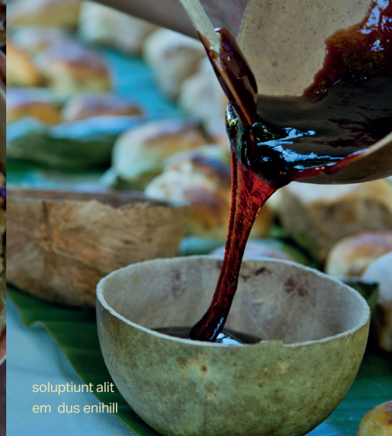
soluptiunt alit em dus enihill