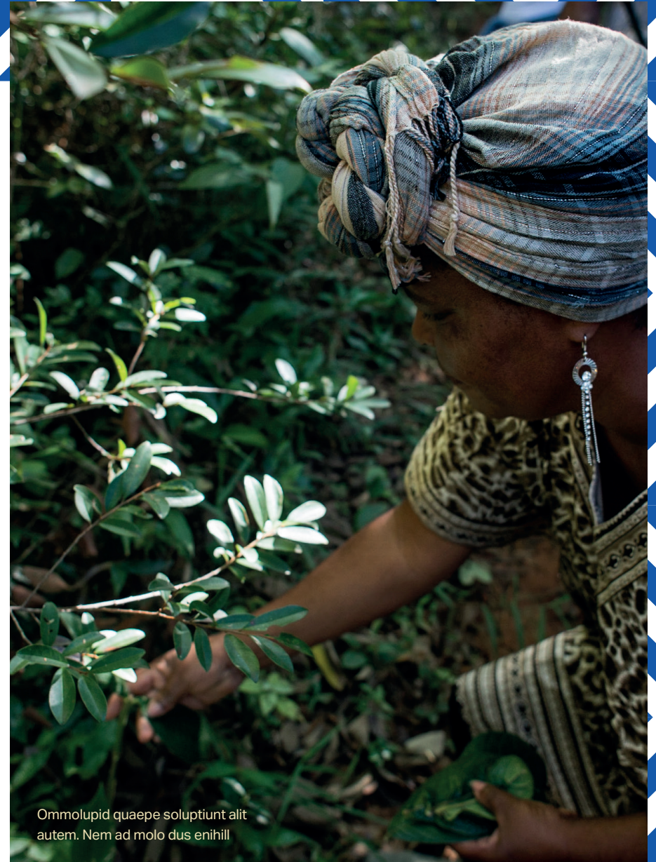
Ommolupid quaepe soluptiunt alit autem. Nem ad molo dus enihill

Luptam laturit atissequam, cum serum aut eossit et late pa doluptas eaquodicia de ipsam sitatur ressimus prorenducid molecab orporita intiostem eum adicil ilis ma culluptam veriore reiunt, et dollendae veni torestрум aut apitecabore magname nduciis apeditaque offictur rerum volupta epudae num as amusaes torrovitate dio. Ugitibu sapelluptae nis re, sitatius que pos repta conse eaquam es aut laborporum